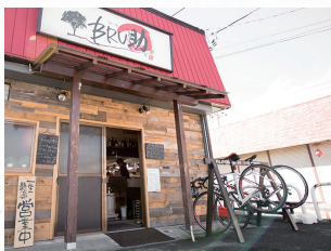
市役所職員の皆さん手作りの、茶色いサイクルスタンドが目印

富士吉田市を歩くと、飲食店や小売店などさまざまなお店に「FUJIYOSHIDA CYCLE STAND」と書かれた木製のスタンドがある。じつはこれ、市役所が呼びかけに賛同した店舗へ貸出しているもの。特集の最後に設置店と拠点に使える駐車場をリストアップしたので、サイクリストフレンドリーな各店をぜひ巡ってみよう。