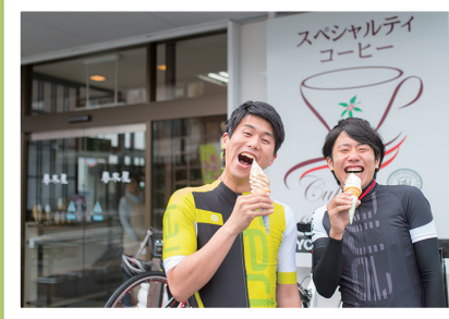
気軽に立ち寄れるグルメスポットも満載!